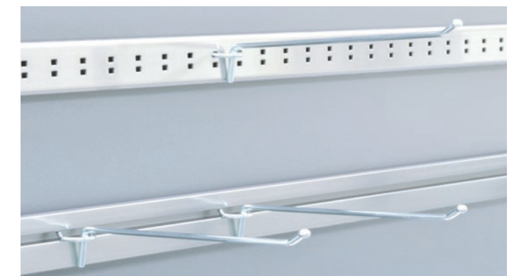
Barra porta blister - Blister panel - Barre porte-blister - Panel Soporte para Blister - Halter für Blister-Packungen