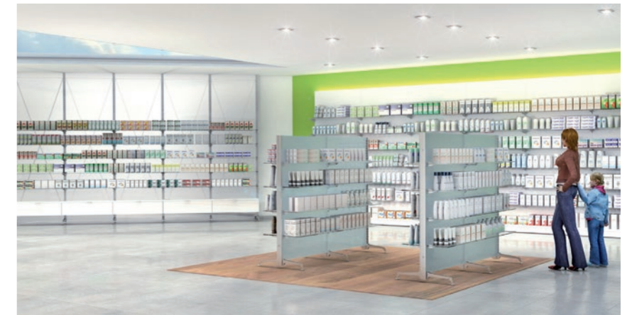
Realizzazioni sviluppate con il sistema Axon L, finiture in vetro, laminato o metallo laccato. Realisations developed with Axon L system, glass finishing, laminate or lacquered steel. Réalisations avec le système Axon L; finition en verre, laminé ou métal laqué. Proyectos desarrollados con el sistema Axon L, acabados en cristal laminado o metal lacado. Ausführungen mit dem System Axon L: Oberflächen aus Glas, Laminat oder lackiertem Metall.