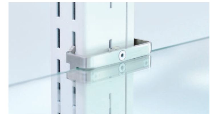
Mensola CRT - Shelf CRT - Console CRT - Repisa CRT - CRT-Konsole

Axon L: Version ohne Füße, mit Befestigung an der Decke, Regale und Verkaufstheken. Oberflächen in Edelstahl matt, Füße aus eloxiertem Aluminium.